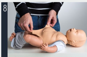
8 Posizionare la copertura del torace e fissarla agli appositi ganci.