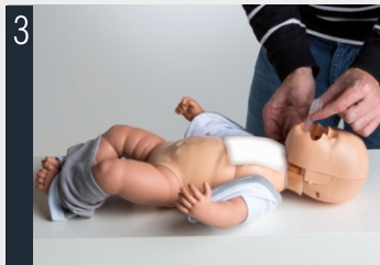
3 Far passare il polmone sotto la mascella.