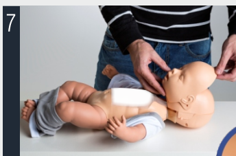
7 Posizionare la copertura del volto e assicurarsi che il naso, la bocca e che la linguetta superiore combacino correttamente.