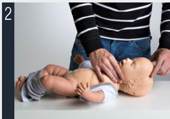
2 Rimuovere la copertura del volto.