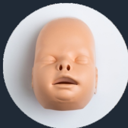
COPERTURA DEL VOLTO (Ref. Face-PB)