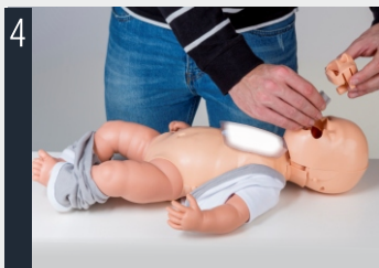
4 Collegare la valvola al polmone.