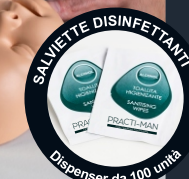
SALVETTE DISINFETTANTI PRACTI-MAN Dispenser da 100 unità

Per garantire una pulizia corretta del manichino, utilizzare le salviette disinfettanti.