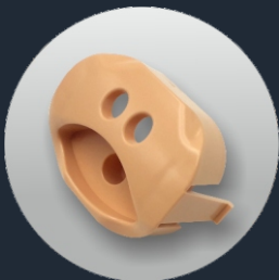
VALVOLA (Ref. SP-002 (PB))