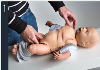
1 Rimuovere la copertura del torace.