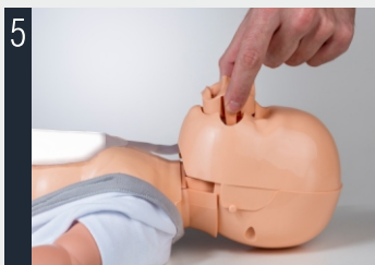
5 Assicurarsi che la valvola sia correttamente collegata alla testa.