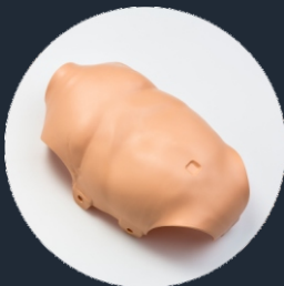
COPERTURA DEL TORACE (Ref. Chest-PB)