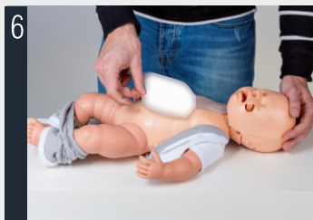
6 Posizionare il polmone sul torace usando l'adesivo.