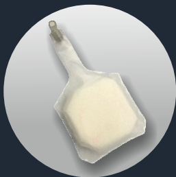
POLMONE (Ref. SP-001 (PB))