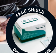
FACE SHIELD PRACTI-MAN Dispenser da 50 unità

La protezione durante la formazione viene integrata con l'utilizzo di maschere di respirazione protettive.